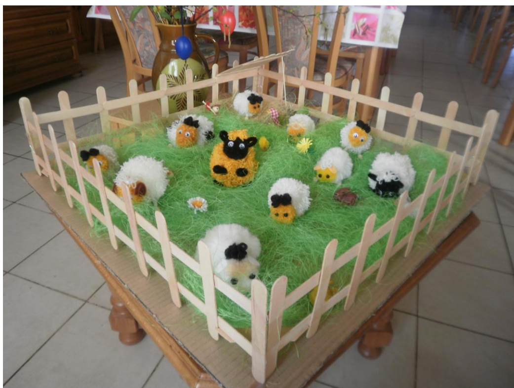
Tak se bavíme – slavíme Velikonoce

Klienti jsou do zařízení přijímáni na základě své žádosti, nebo žádosti opatrovníka. S každým žadatelem je v předstihu vedeno podrobné jednání, kdy je ještě před definitivním podáním žádosti informován o všech skutečnostech a podmínkách pobytu v ÚSPD Věž. Do pořadníku čekatelů na umístění je zařazen až na základě svého skutečného plnohodnotného rozhodnutí. Společný život v zařízení je upraven a definován Domácím řádem a přizpůsoben specifickým potřebám klientů s chronickým duševním onemocněním. Všichni klienti mají od roku 2017 podepsány smlouvy o poskytování sociálních služeb. Všichni klienti mají klíčového pracovníka. K volbě klíčového zaměstnance jsme přistupovali po vzájemné dohodě s klienty. V zařízení je plně rozvinutý systém individuálních plánů, včetně tvorby a průběžného vyhodnocování a upravování dle potřeb klientů.