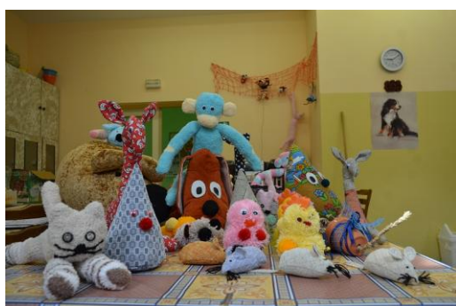
Ve Věži 23.3.2013