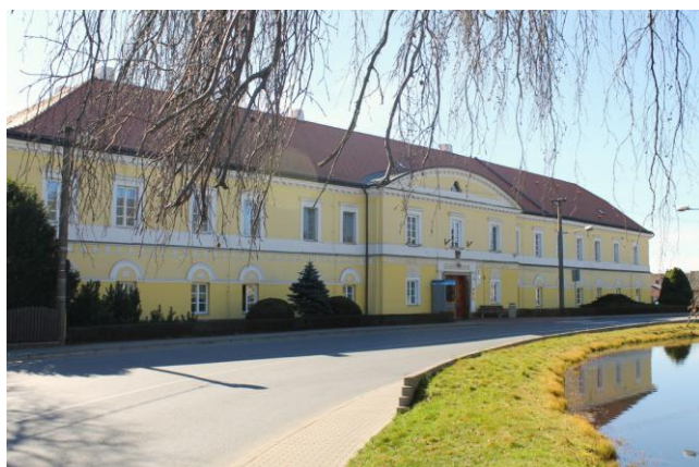
Ve Věži 23.3.2014